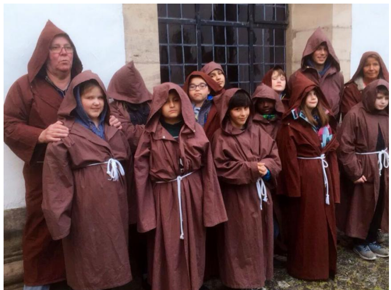
im ehemaligen Kloster Hardehausen

Im Wonnemonat Mai waren wir, die Klasse 4b, auf Klassenfahrt. Das Ziel war der Jugendbauernhof in Hardehausen. Wir haben dort in 3 Gruppen gearbeitet: Küche, Stall und Garten. Wir wissen nun, wie man Radieschen, Wicken und Sonnenblumen auslegt, Kartoffelfelder ausjätet, Hühner und Schafe füttert, Gurken, Rhabarber und Möhren schneidet. Wir kennen den Unterschied zwischen Kühen und Wisenten, Hühnern und Schafen. Wir sind jetzt die Jungbauern der Lindenschule Hamm. In der Freizeit gingen wir kegeln und schwimmen oder mit einem Förster in den Wald. Auch ein ehemaliges Kloster haben wir besichtigt Es war eine tolle Fahrt.